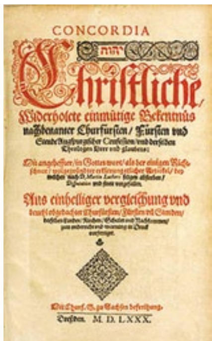
Das Konkordienbuch von 1580 ist die vollständige Sammlung der Bekenntnisschriften der lutherischen Kirche in deutscher Sprache

Dass die Heilige Schrift nicht vollumfänglich Gottes Wort ist, müsste jedem Leser dank deren Klarheit