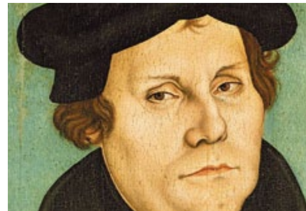
Martin Luther (1483-1546)

Mit gutem Grund schreibt Martin Luther in seiner Auslegung zum dritten Gebot im Großen Katechismus über die Anweisung zur Sabbathheiligung: „Dieses Gebot [geht] uns Christen nach dem grob-äußerlichen Wortsinn nichts an. Denn es handelt sich um ein ganz äußerliches Ding, das, wie andere Satzungen des Alten Testaments, an besondere Weisen,