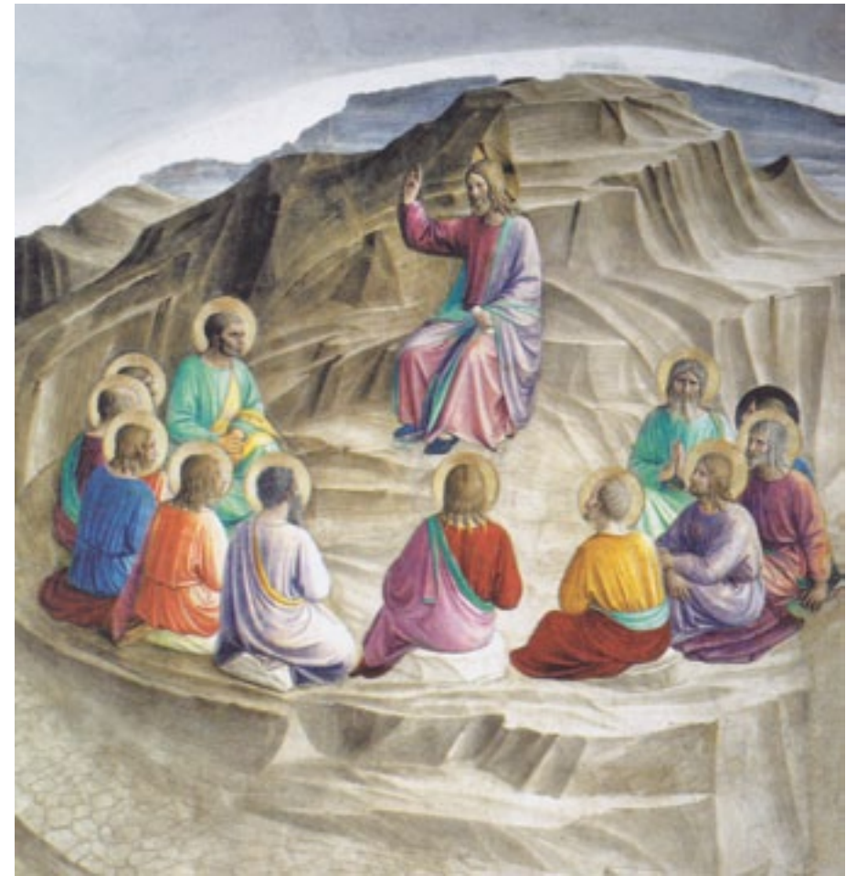
Die Bergpredigt, Fra Angelico (um 1386-1445), Kloster San Marco, Florenz

Der Zorn des kreuzesgelästerten Gottes stellt keine irdische Gefahr dar. Insofern besteht für eine staatliche Strafverfolgung von Gotteslästerung, wie sie durch Kaiser Justinian nach 538 n.Chr. mit der Novelle 77 im römischen Reich eingeführt hat, keine Rechtsgrundlage. Dieser hatte