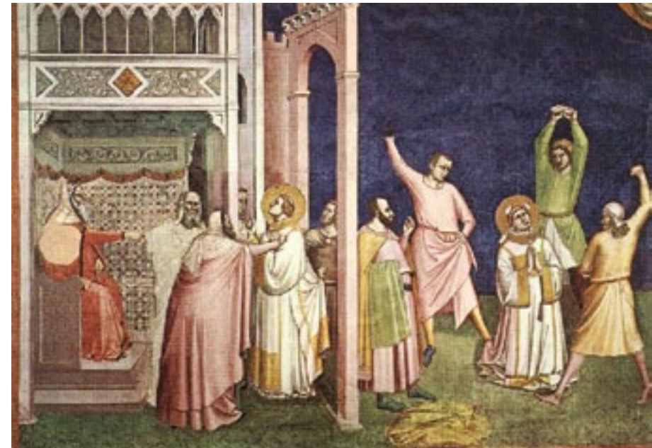
Die Steinigung des Stephanus, dem ersten christlichen Märtyrer, wegen Gotteslästerung (Apg 7), Bernardo Daddi (um 1295-1348), Fresko in der Kirche Santa Croce, Florenz

Was soll man als Christ einem alttestamentlich begründeten Tötungsgebot bei Gotteslästerung entgegenhalten, wenn es in Artikel 2 der evangelikalen Lausanner Verpflichtung von 1974 über die Autorität der Bibel heißt: „Wir halten fest an der göttlichen Inspiration, der gewissmachenden Wahrheit und Autorität der alt- und neutestamentlichen Schriften in ihrer Gesamtheit als dem einzigen geschriebenen Wort Gottes. Es ist